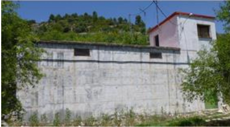
Depósito Nou Balones