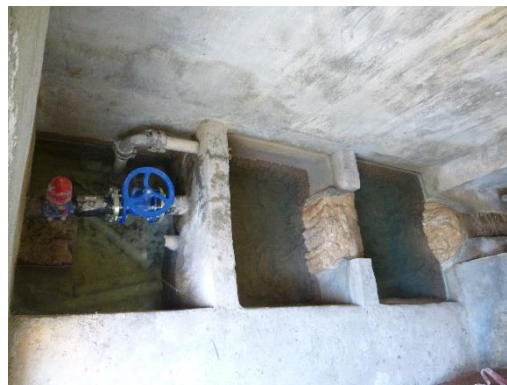
Interior caseta Font de la Serella