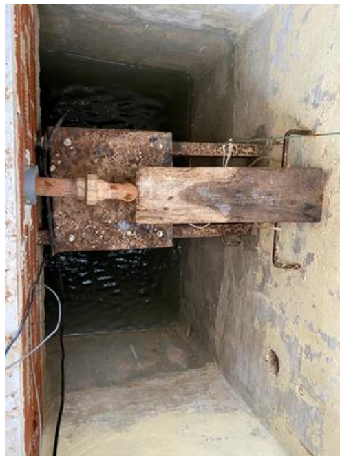
Cántara manantial. Font Espiritu Santo