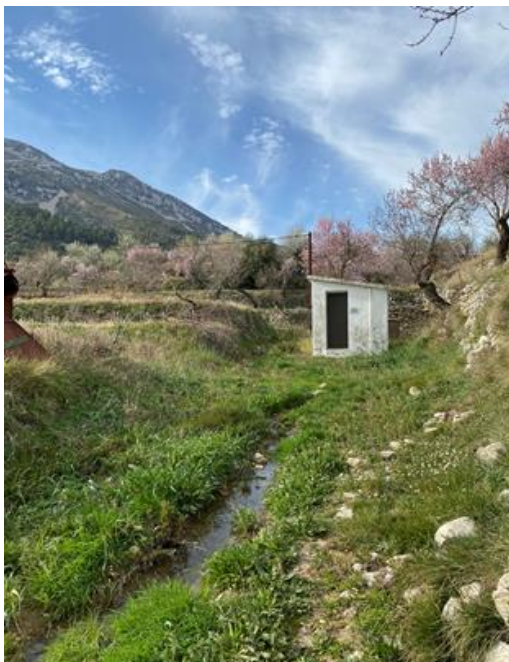
Caseta manantial Font Esp. Santo