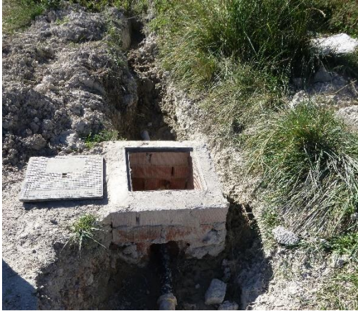
Arqueta con válvula reductora de presión en el camino La Parà.

Por las diferencias geométricas existentes en el trazado de la red y la extensión de la misma, aparecen zonas con sobrepresiones que se encuentran limitadas por la instalación de válvulas reductoras de presión de pequeño diámetro, localizadas en los ramales de la zona del diseminado. Una de ellas, ubicada en el Camino la Parà, cuyo manómetro marcaba en visita de campo 3,5 atm y, otra, situada en el ramal del diseminado cuyo trazado discurre en paralelo a la CV-720 en dirección a Benimassot, concretamente en el interior de una galería situada bajo la carretera anterior a la altura del cruce con el Camino de la Cooperativa. Esta última válvula se encontraba tarada a 2 atm.