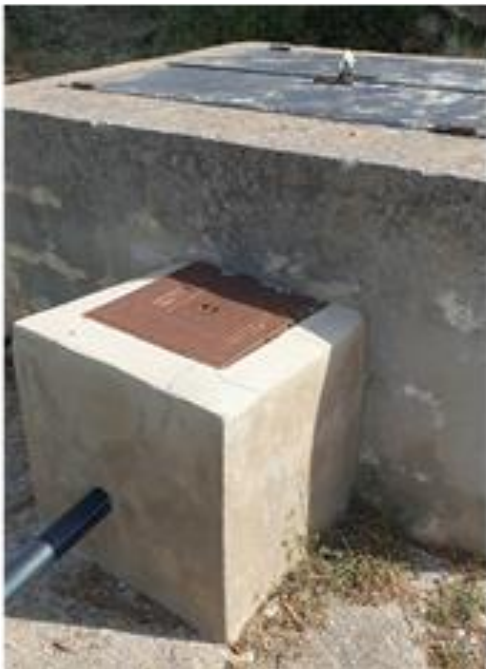
Pou Font de la Vaca, conexión desde Pou L'Aigüeta (Millena)