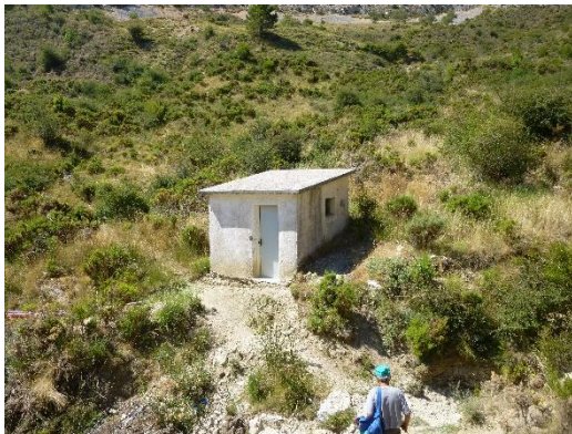
Caseta Manantial Font de la Serella

En caso de necesidad también es posible abastecer a la población a través de los caudales proporcionados por el Pozo Pozo Perelló, localizado en el municipio vecino de Benimassot. El punto de entrega del agua procedente de Benimassot se realiza en la conducción de subida desde la arqueta de la Font del Espiritu Santo hasta los Depósitos, en cuyo caso y mediante el cierre de válvulas es la única fuente que abastece a los depósitos. En el año 2020 la aportación ha sido muy pequeña, y únicamente se realiza para comprobar el adecuado funcionamiento de las instalaciones de aporte.