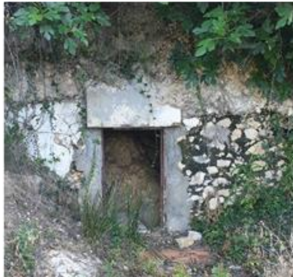
Manantial Les Coves

El otro manantial natural que realiza una aportación significativa al abastecimiento municipal es el manantial Costurera, existiendo una conducción que transporta los caudales captados desde la arqueta de toma, situada en el interior de una caseta, hasta la reelevadora Costurera situada en el casco urbano.