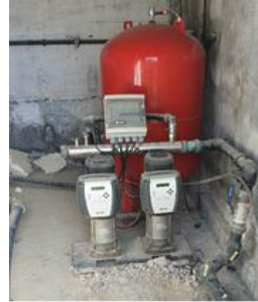
Grupo de presión parte alta

El depósito está dotado de un sistema de cloración automático con sensor de cloro libre residual y bomba de recirculación. La totalidad de los caudales servidos a la red de distribución son clorados en este depósito. Igualmente dispone de un caudalímetro a la salida del mismo.