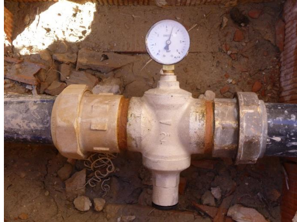
Válvula reductora de presión de pequeño diámetro (DN 2") ubicada en la arqueta.