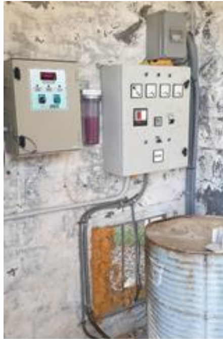
Cuadro maniobra pozo Font de la Vaca