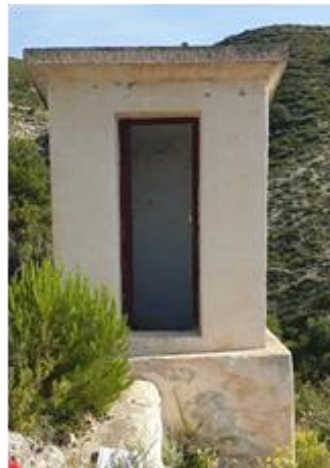
Caseta manantial Carrascalet

El agua aportada por los manantiales Carrascalet y Les Coves se unen en un punto de confluencia desde el que parte una tubería que por gravedad la transporta hasta el depósito municipal. Hay instalado un caudalímetro junto al depósito que permite conocer el volumen de agua aportada por estos dos manantiales y establecer su régimen de aportaciones a lo largo del año