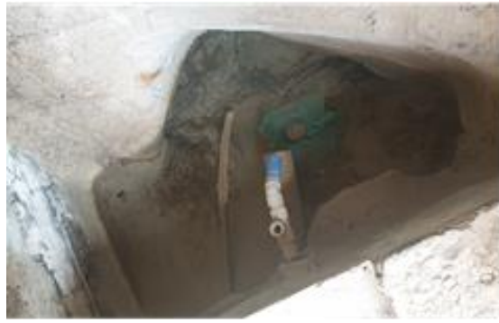
Interior caseta Manantial Costurera