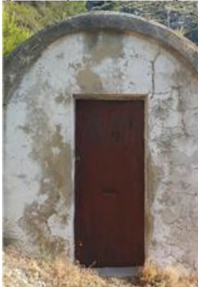
Caseta confluencia de manantiales

El agua aportada por los manantiales Carrascalet y Les Coves se unen en un punto de confluencia desde el que parte una tubería que por gravedad la transporta hasta el depósito municipal. Hay instalado un caudalímetro junto al depósito que permite conocer el volumen de agua aportada por estos dos manantiales y establecer su régimen de aportaciones a lo largo del año