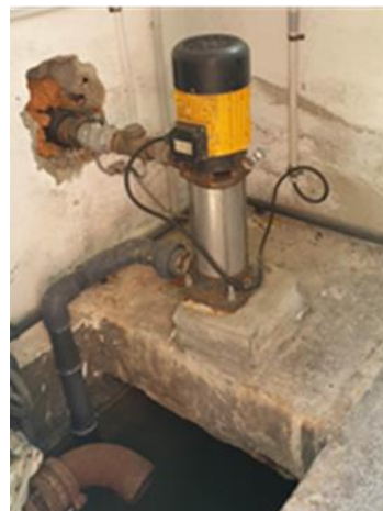
Interior Reelevadora Costurera