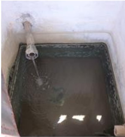
Arqueta rotura carga man. Carrascalet

La principal aportación de agua a la población lo realizan los manantiales que garantizan un caudal suficiente para las necesidades de la población. Sin embargo en verano, coincidiendo con la punta de población estival y la lógica merma en la aportación de los manantiales, se hace necesaria la aportación del pozo Font de la Vaca. Igualmente este pozo actúa como alternativa de emergencia en caso de que hubiera algún problema en las conducciones que transportan el agua desde los puntos de toma hasta el depósito municipal.