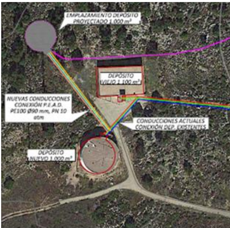
Emplazamiento y conexiones depósitos Fageca