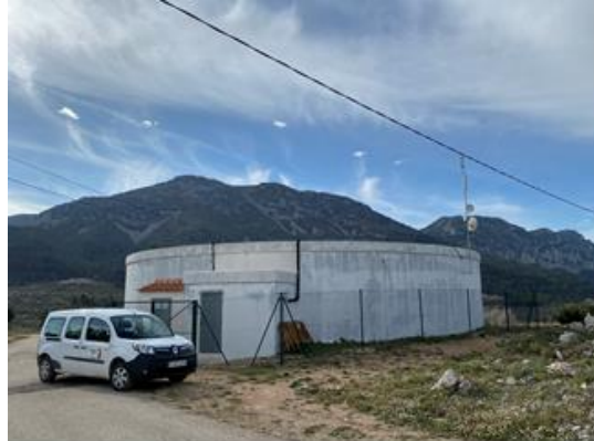
Depósito Nuevo Fageca 1