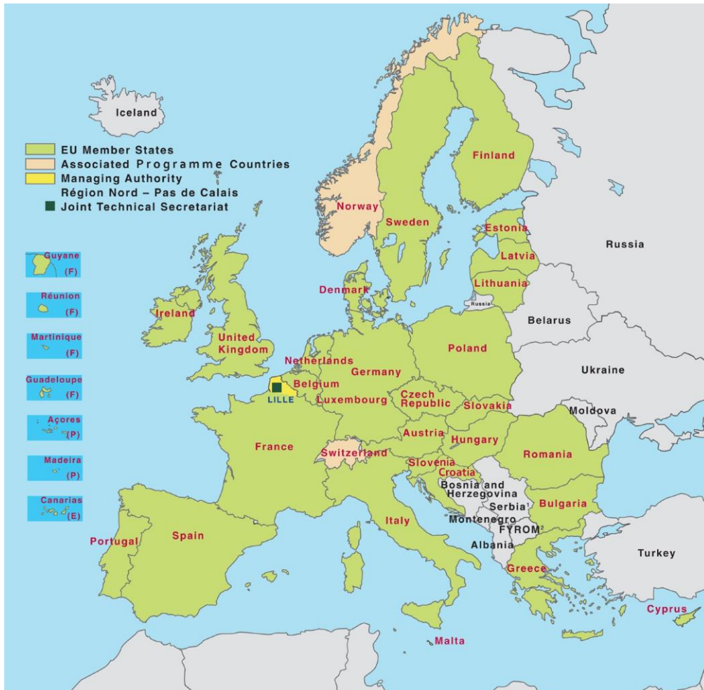
Territorio elegible para el programa Interreg Europe .

La Cooperación Interregional cuenta con un único programa, denominado Interreg Europe , con un presupuesto total de 359 millones de € para el periodo 2014-2020. Actualmente está abierta la que posiblemente sea la última convocatoria de este programa. El programa prima la innovación de las propuestas, así como la experiencia de los consorcios solicitantes, principalmente.